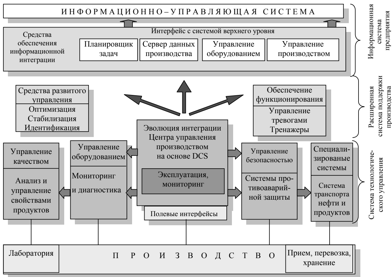
Рис.2. Элементы подхода Yokogawa